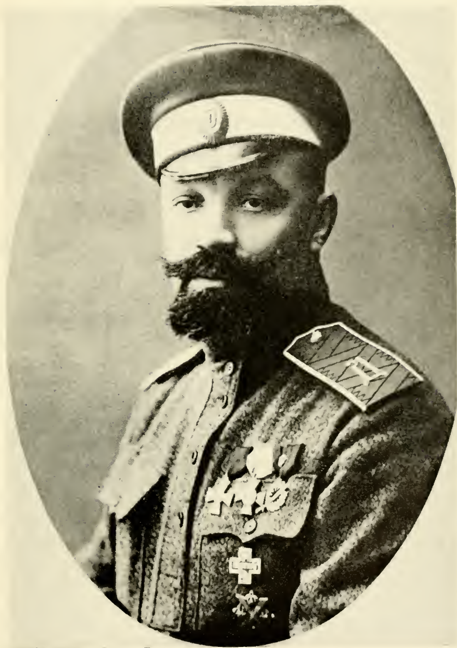
Генерал А. П. КУТЕПОВ