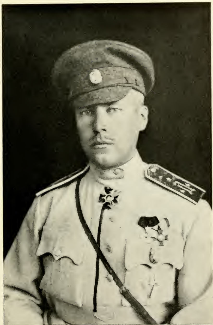
Генерал-Лейтенант В. К. ВИТКОВСКИЙ (1921 г)