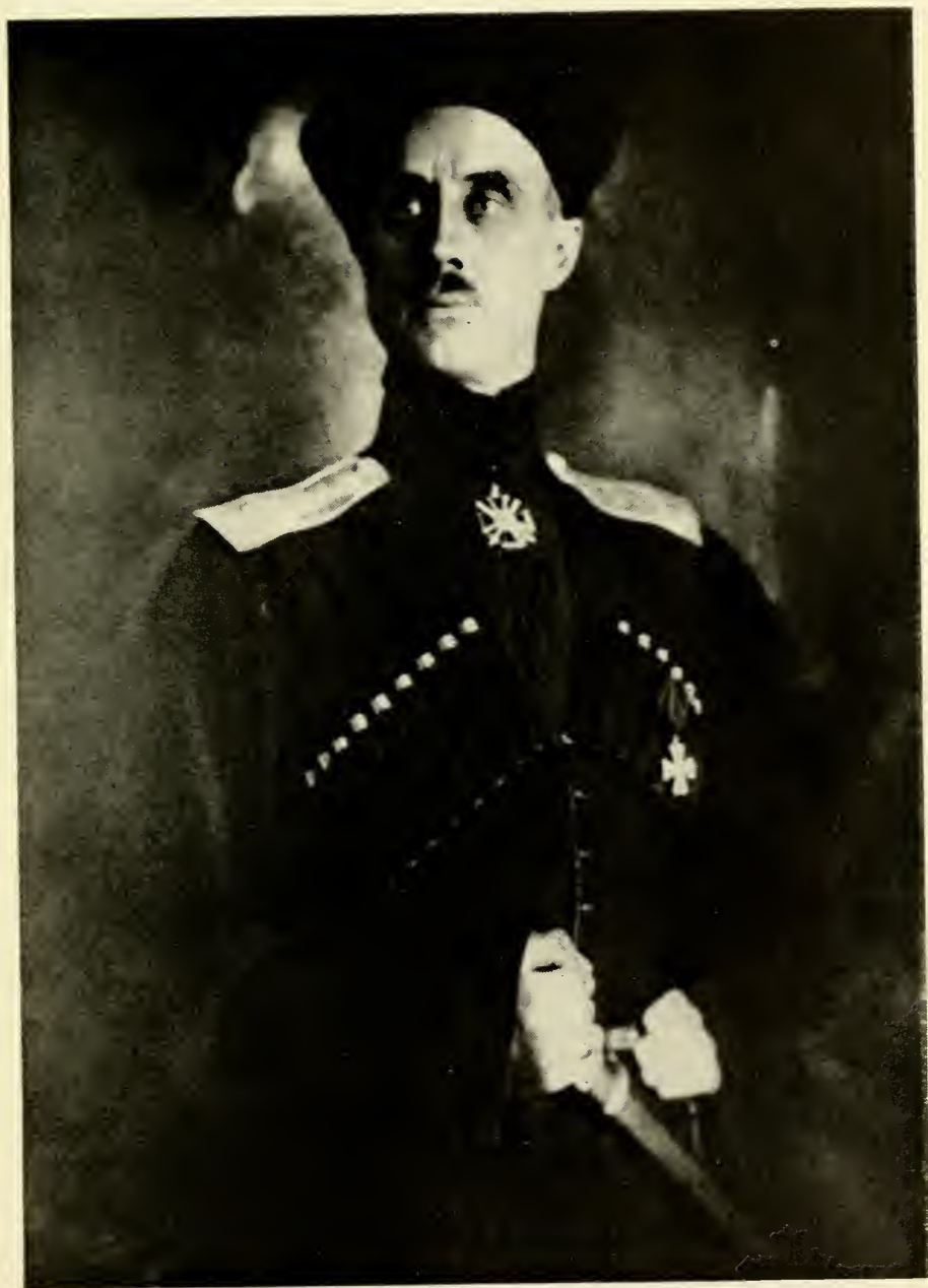
Генерал Барон П. Н. ВРАНГЕЛЬ